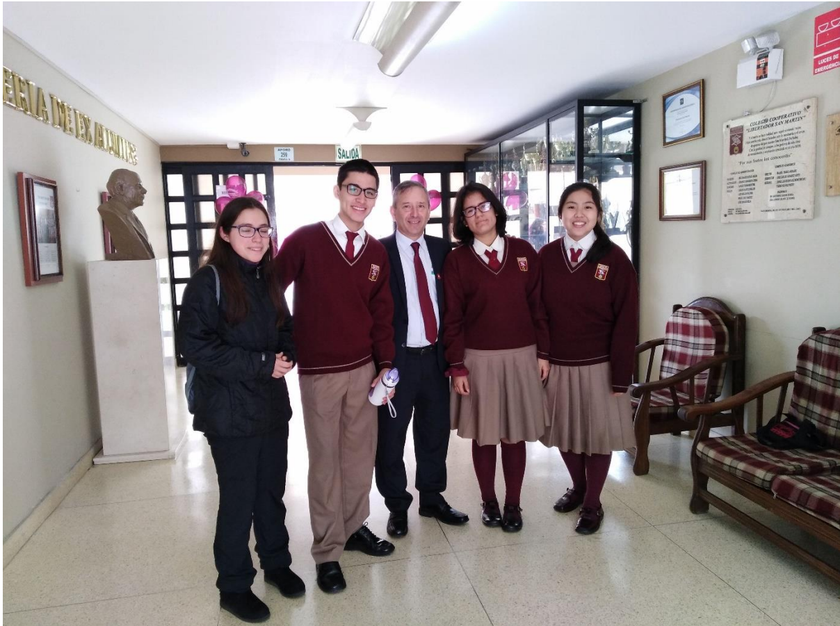
Figura 1. Foto de estudiantes del colegio