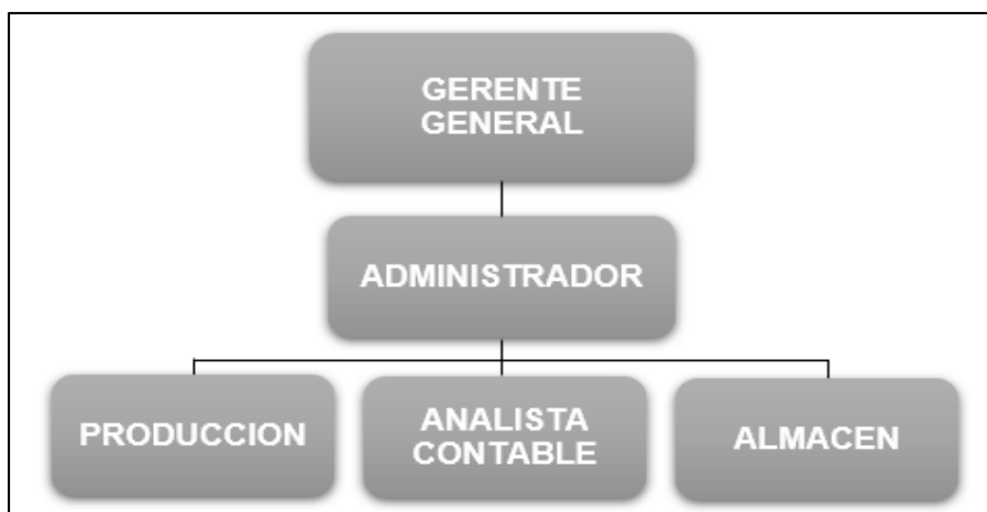
Figura 2. Organigrama de la empresa Toldos Alvarez SAC

A continuación, el organigrama de la empresa: